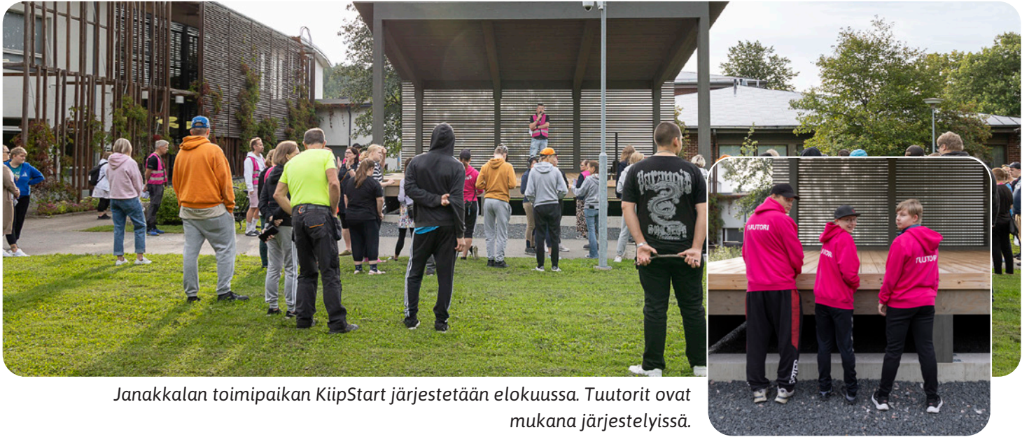
Janakkalan toimipaikan KiipStart järjestetään elokuussa. Tuutorit ovat mukana järjestelyissä.